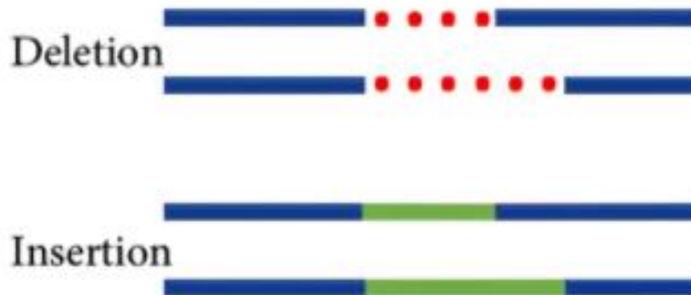
Рис. 2. Делеция и инсерция локуса.

Для генотипирования штаммов Y. pseudotuberculosis в настоящее время используют разнообразные молекулярно-биологические методы. Ранее нами был успешно применен метод INDEL-генотипирования для V. cholerae и Y. pestis .